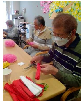
お母さんたちの為にカーネーション作り