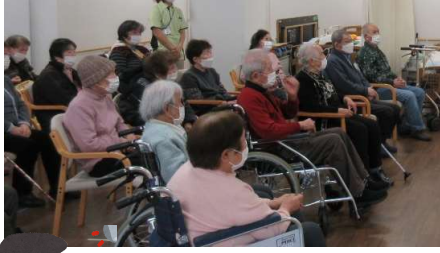
皆さん真剣に話を聞いておられました